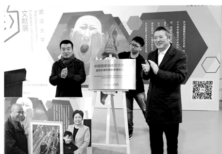
本报讯(记者严航)被誉为“中国最具影响力的十个当代艺术家”之一的方力钧先生,集积累50余年的历史性文献资料、手稿和重要作品,近日在万林艺术博物馆展出。展览集合丰富的文献史料、图片、手稿、影像,从微观、中观、宏观三个层面,真实记录了其个人创作生涯、文艺发展进程、社会经济潮流三个维度的时空演进,全面系统地呈现了一位艺术