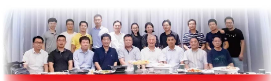
武汉大学深圳校友会计算机分会筹备会议

本报讯 10月14日晚，计算机分会20多位组委会成员齐聚珞珈文化空间，共同商讨分会成立事宜。珞珈文化空间里随处可见的珞珈元素，让与会成员感受到了一种浓浓的“珈”的温暖。大家围绕分会成立的各项条件展开了热烈讨论，纷纷表达各自对分会成立的感想与建议。本次筹备会议就分会成立事宜达成了统一