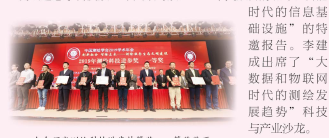
大会颁发测绘科技进步特等奖、一等奖奖项

本届学术年会是中国测绘学会建会60周年之际召开的一次盛会。年会主论坛上，院士专家围绕测绘遥感学科发展60年回顾与展望、自然资源大格局下的新型基础测绘、军民融合的北斗、北斗导航技术在现代农业中的应用等主题做了精彩报告。同期举办了科技与产业沙龙和14场分论坛。李德仁、刘经南分别作了题为“测绘遥感学科发展60年回顾与展望”“军民融合的北斗：智能