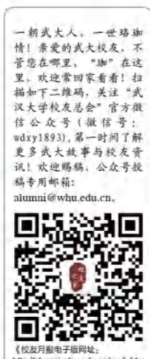
《校友月报》编辑部地址：http://alumni.whu.edu.cn/xyb.htm

海南校友会举办“迎国庆国运昌盛 谋发展珞珈精神”座谈会 9月30日下午，海南校友会企业家分会在海口珞珈咖啡举行企业家校友“迎国庆国运昌盛 谋发展珞珈精神”座谈会。座谈会历时两个小时，校友们畅所欲言，就企业家分会的工作宗旨、工作方式和计划展开热烈讨论，提出了很多有创意和可行性的想法。为校友之间的互帮互助创造了更多机会。与会者收获多多，祝福满满。（海南校友会）