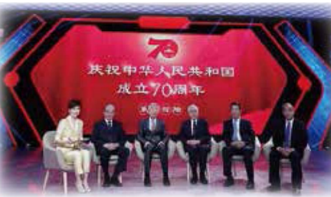
（校友总会根据武汉大学新闻网2019年8月19日相关报道整理）

本报讯 8月29日，第五届全国非公有制经济人士优秀中国特色社会主义事业建设者表彰大会在北京召开，100名非公有制经济人士和新的社会阶层人士获得“优秀中国特色社会主义事业建设者”荣誉称号。武汉大学4位校友获此殊荣，他们分别是：泰康保险集团股份有限公司董事长兼首席执行官陈东升、小米集团首席执行官的雷军、卓尔控股有限公司董事长阎志、华讯方舟科技有